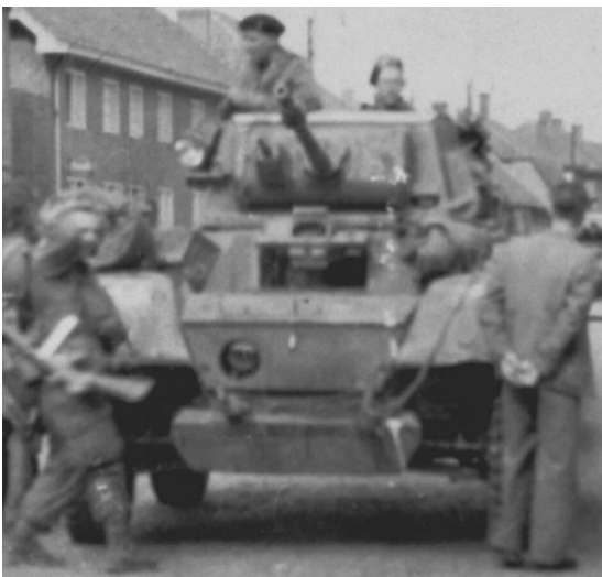
Palmer rijdt Eindhoven binnen

Tegen mij zei hij: "Als "Jerry"2) ons kan zien, rijden wij altijd heen en weer om het moeilijker voor hem te maken ons te raken. Zo'n pantserwagen is wel tegen geweeren licht mitrailleurvuur bestand, maar niet tegen kanonvuur.