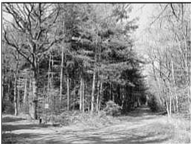
Het vroegere Kraaienbos, tegenwoordig onderdeel van de Herbertusbossen. Links de Boschlaan. Zie ook inleiding en bij 9 november.

(1) Hoewel in de tekst duidelijk het getal 25700 staat geschreven, lijkt dit aantal sterk overdreven. Zouden het geen 257 bomen moeten zijn geweest en zou bij de notering geen punt of komma achter het cijfer 7 vergeten zijn?