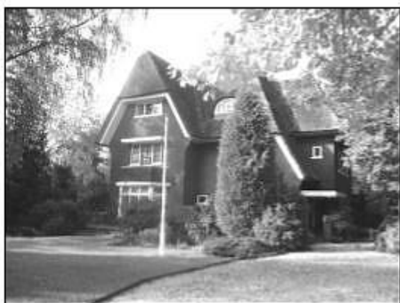
Cleyn Eimerick, Oude Stationsstraat 16. Op 26 oktober 1944 (zie aldaar) verhuisde het tijdelijk gemeentehuis van Heeze uit het kasteel naar deze villa.

Het kasteel van Heeze en zijn directe omgeving werd in de maand oktober 1944 grotendeels bevolkt door ingekwartierde militairen. Het was daar een komen en gaan van geallieerden. In het kasteel was destijds ook het gemeentehuis van Heeze gevestigd. Uit het hier gepubliceerde dagboek blijkt dat het gemeentehuis van 26 tot en met 28 oktober 1944 uit het kasteel is verhuisd naar Cleyn Eimerick, de villa van dokter H.J. Kwisthout in de (Oude) Stationsstraat te Heeze, om plaats te maken voor 175 Amerikaanse officieren en manschappen.