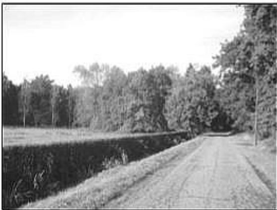
De langs het kasteel van Heeze lopende Boschlaan (zie 7 oktober) vormt een verbinding tussen de Somerenseweg ten oosten van de dorpskom en de Kabelstraat ten noorden van de dorpskom.

Na de slagregen van gisteren zijn de bospaden absoluut onbegaanbaar. De zware Amerikaanse tanks hebben de wegen in rivieren veranderd. De heerlijkheid Heeze moet 30 [moeilijk leesbaar; misschien staat er: 80] zware bommen leveren voor het herstel van de spoorbrug bij Weert.