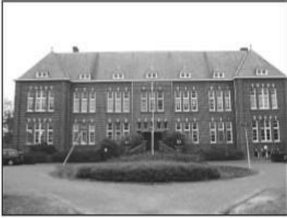
Huisje Providentia, het oude klooster, Albertlaan 19, Sterksel, waar tegenwoordig een kinderdagverblijf gevestigd is. In de oorlog deed Providentia dienst als school van de Hitler-Jugend en later nog als militair hospitaal (zie 5 en 12 oktober).