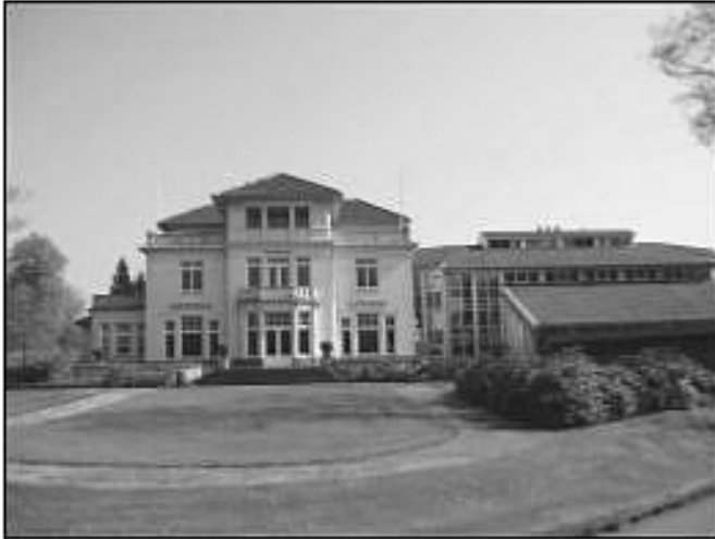
De plaats van het Eindhovense Diaconessenhuis, waar de baron van Heeze op 10 jan. en 17 febr. 1945 werd geopereerd; tegenwoordig Dommelhof, verpleeg- en reactivatiecentrum aan de Parklaan.

Tegen Kerstmis (23 december) kwam het bericht, dat de Canadezen enorme houtvorderingen hadden. Er zal heel veel weg moeten van de mooie bossen. Ook veel van Geldrop.