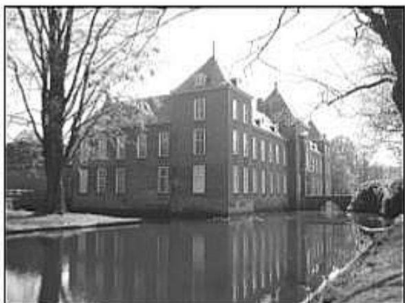
Kasteel van Heeze, voorgevel vanuit het noorden.