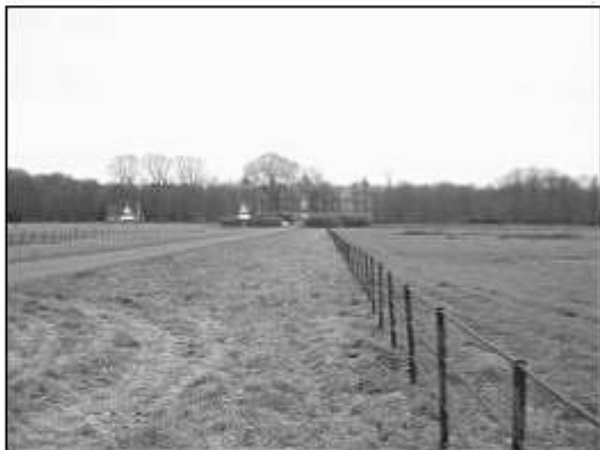
De oprijlaan met weide vóór het kasteel van Heeze. Hier maakte een vliegtuig een noodlanding (zie 4 oktober) en verbleven ingekwartierde Amerikaanse militairen in tenten (zie 28 oktober).