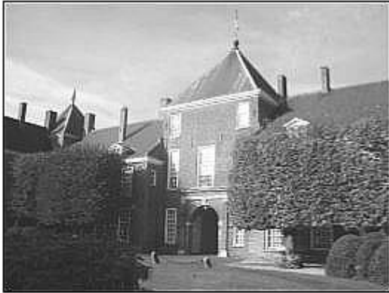
Binnenplein met toegangspoort van het kasteel. "Stil en verlaten lag het binnenplein daar na alle bedrijvigheid van de laatste dagen. De deur ging weer dicht".