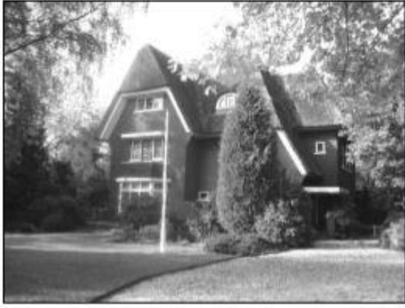
Cleyn Eimerick, Oude Stationsstraat 16, destijds woning van dokter H.J. Kwisthout. Zie 12 september.