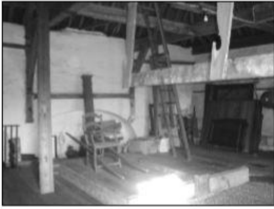
Zolder van kasteel Heeze boven de toegangspoort. Op de verhoging is een oude draagstoel van de vroegere bewoners zichtbaar.