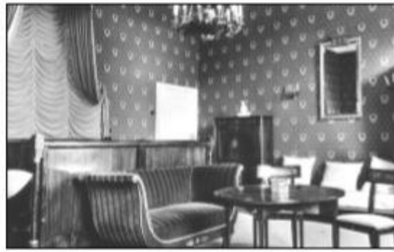
De Empire-kamer van kasteel Heeze, waar soldaten waren ingekwartierd.