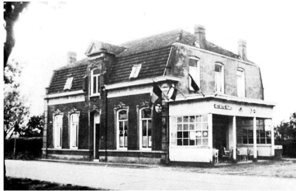
Café 't Witte Paard

Café Rustoord aan de Luikerweg 145, heette na de oorlog 't Witte Paard.