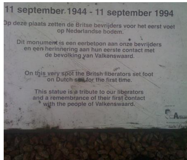
(Arjan Rijkers & Kees Smolders)