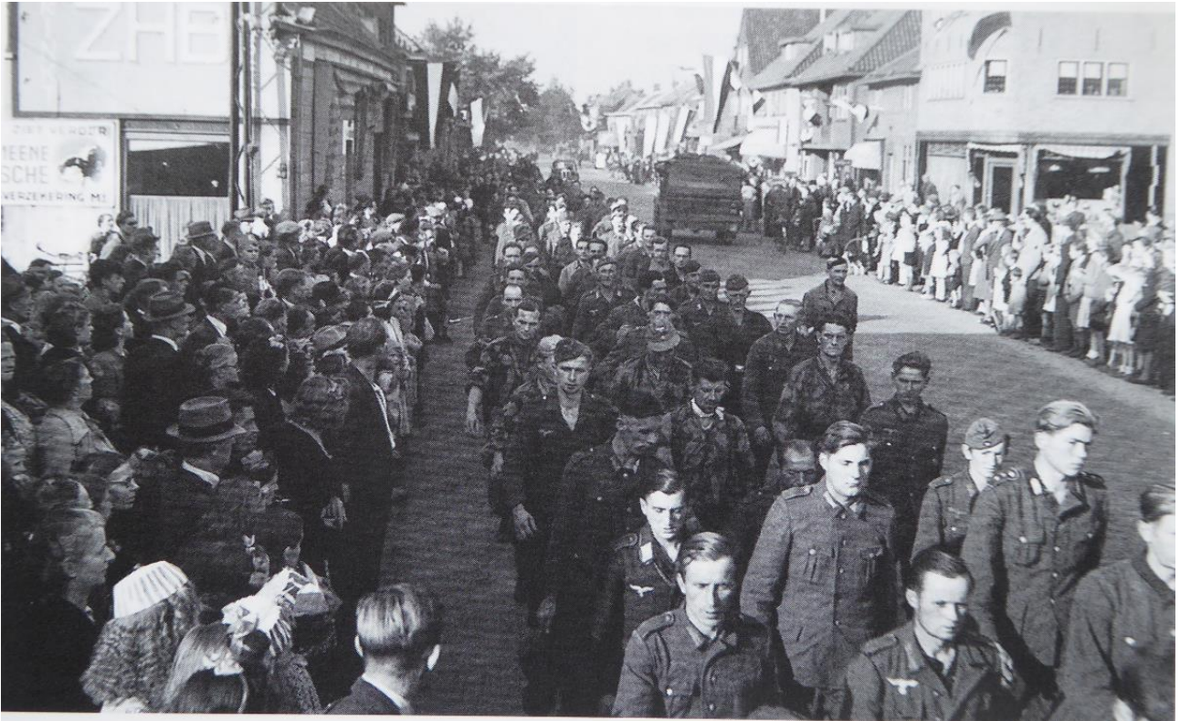
Op de Eindhovenseweg onder Aalst worden in Eindhoven gevangene Duitsers in de richting van Valkenswaard afgevoerd.

Dan eventueel maar liever samen de lucht in !".