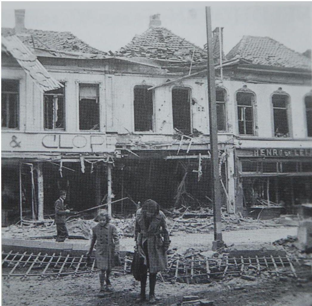
In Eindhoven ontstond grote schade na het bombardement in de nacht van 19 op 20 september.

's Avonds - ik zat met wat vertraging aan de soep - kwam er echter iemand bij ons binnen, die zei snel de vlag binnen te halen. Er zouden Duitse vliegtuigen in de lucht zijn. De trek van militairen stopte. We besloten naar de provisorische schuilkelder te gaan, niet wetend wat er boven ons hoofd hing. Toen de bominslagen na verloop van tijd ophielden, gingen we naar buiten en zagen wat er aan de hand was. Eindhoven in een zee van vuur. Je begrijpt dat de stemming meteen omsloeg, zeker omdat er geruchten waren dat de Duitsers aan het oprukken waren. Gelukkig bleek dit allemaal niet waar en was voor ons de definitieve bevrijding een feit en was de oorlog voorbij.